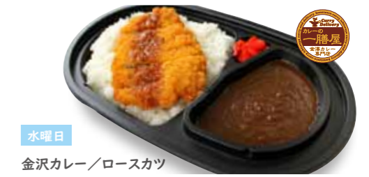
水曜日 金沢カレー/ロースカツ 金沢カレー・ごはん・福神漬け