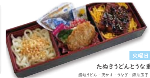
火曜日 たぬきうどんとうな重 讃岐うどん・天かす・うなぎ・錦糸玉子・ヒレカツ・ポテトサラダ・めんつゆ・しょうが