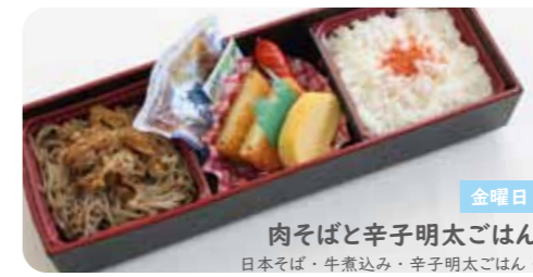
金曜日 肉そばと辛子明太ごはん 日本そば・牛煮込み・辛子明太ごはん・コロッケ・玉子焼き・ウインナー・めんつゆ・わさび