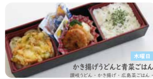
木曜日 かき揚げうどんと青菜ごはん 讃岐うどん・かき揚げ・広島菜ごはん・照り焼きチキン・めんつゆ・しょうが