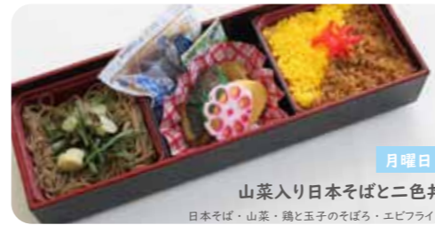
月曜日 山菜入り日本そばと二色丼 日本そば・山菜・鶏と玉子のそぼろ・エビフライ・タルタルソース・めんつゆ・わさび

めんセットと金沢カレー ¥560 税込 ご注文・変更等は、前営業日午後1時までにお問い合わせください。季節膳は、2週ごとに種類を入れ替えいたします。